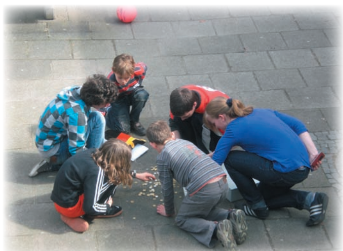
Kassensturz im Innenhof

Kaum sind wir auf dem Wolfsberg angekom- men, haben 6 Runden Schach gespielt, Freunde gefunden und Spaß gehabt, steht auch schon der Abschlußabend vor der Tür. Um die schö- ne Woche auf der JEM NRW 2010 gebührend abzuschließen, werden sich alle um 19:30 Uhr im Turniersaal eintreffen. (Für diejenigen, die diese freundliche Formulierung nicht verste- hen: ES IST ANWESENHEITSPFLICHT). Wir versuchen einen kurzen und knackigen Abend zu veranstalten, damit ihr am letzten Abend noch ein wenig Zeit mit euren Freunden verbringen könnt. Es erwarten euch das alt bewerte „Schlag die Teamer“, die Siegereh- rungen der verschiedenen Veranstaltung und eine Überraschung, die euch sehr erfreuen wird. Wir sehen uns heute Abend. [SL]