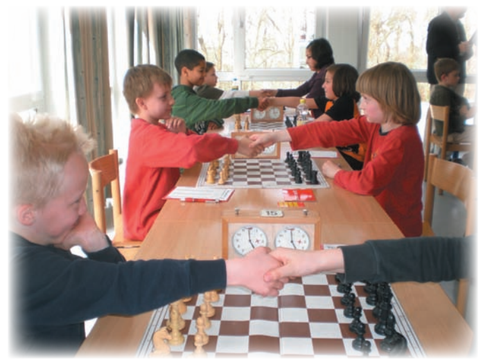
Fair gehts zu in der U10!

Holger: „Hilft Meditation eigentlich gegen Entspannung? Ich wär dabei!“